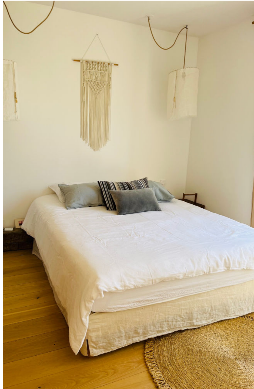
Chambre bohème 1 lit de 160 x 190 1 personne (chambre solo) + salle de bain privée Les 1ères « solo » inscrites ont les chambres solo.