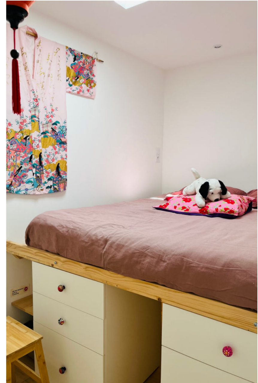
Chambre rose 1 lit de 160 x 190 1 personne (chambre solo) Et d'autres chambres...